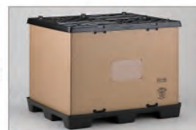
4 上パレットをかぶせてロックで固定。