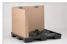
2 下パレットにスリーブをのせる。