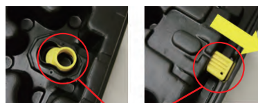
スリーブ固定ロック

パレットにスリーブを固定するロック機能を備えているので、バンド掛け作業の必要がありません！