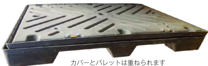
カバーとパレットは重ねられます