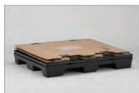
1 ノックダウンの状態