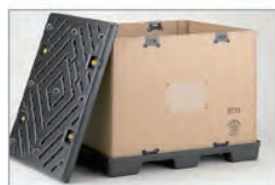
3 下パレットとスリーブをロックで固定。